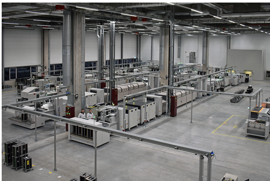
博泽正在塞尔维亚贝尔格莱德投资建设一流的电子制造能力。

如果全球汽车产量保持稳定增长，博泽的销售额有望在2025年达到100亿欧元左右，这主要得益于公司一系列成功的业务拓展：去年，博泽获得了电动门锁系统、冷却风扇模块和前排座椅骨架等方面的战略订单。另外，股东们批准了2023年超过4亿欧元的投资计划，以扩大全球范围内的工厂和生产设施。博泽计划在未来三年内投资超过13亿欧元，其中一半以上将用于欧洲市场，亚洲和美洲市场的投资分别占约四分之一。